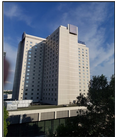
Novotel hotel, Poznan Center