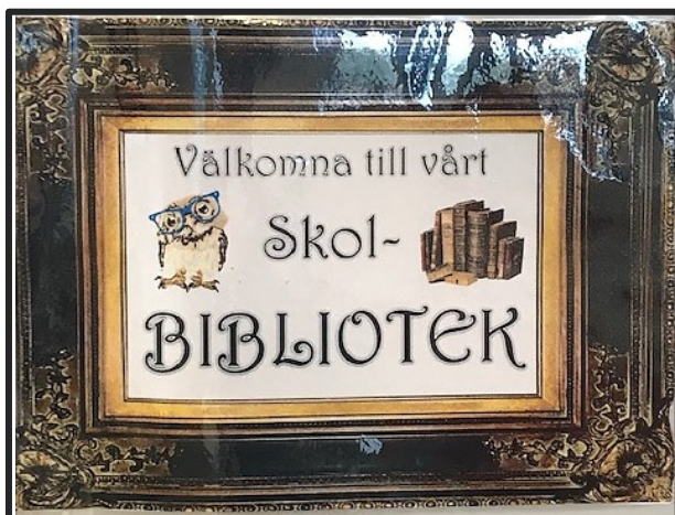
Sjukhusskolans bibliotek "Fokus"

Sjukhusskolan tog under våren kontakt med skolbibliotekschefen om behovet av ett bibliotek på Sjukhusskolan. Detta har nu mynnat ut i ett skolbibliotek på Soma och ett skolbibliotek på BUP och två bibliotekarierna som kommer vara hos oss en gång i veckan. Vi är jättegglade över detta samarbete och framförallt över att våra elever nu kommer att ha tillgång till berikande skön- och facklitteratur under sin sjukhusvistelse.