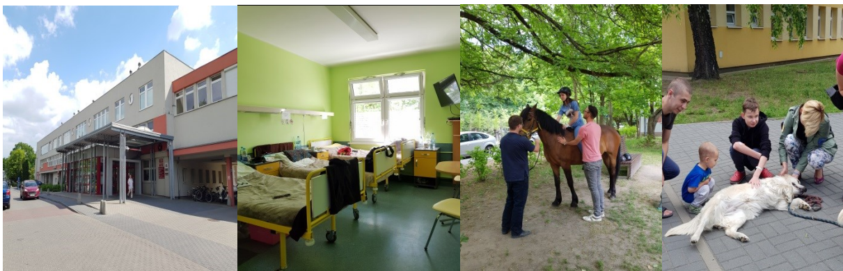
Karol Jonschers barnsjukhus i Poznan.

Poznan är en stad med ca 550 000 invånare, jämförbart med Göteborg i invånarantal. Vid ankomst på tisdagen var det studiebesök på agendan och vi delades in i mindre grupper. Vår grupp besökte Skola nr 110 för kroniskt sjuka barn vid Karol Jonschers kliniska sjukhus. Vi fick en rundvandring på sjukhuset och såg att de var mycket trångbodda på salarna. Det fanns 450 vårdplatser och det kunde ligga upp till 5 barn på en liten sal. Föräldrarna sov i samma sal på golvet! Det fanns små klassrum i anknäring till vårdavdelningarna och drygt 50 pedagoger var knutna till sjukhuset. Drygt 30 av dem var lärare och 20 var lekterapeuter. De arbetade mycket med bild, drama och sång i undervisningen på sjukhuset. Ett mycket trevligt inslag i terapin för barnen på sjukhuset var att de hade möjlighet att få rida. Ett par gånger i veckan kördes en häst till en liten park vid sjukhuset där barnen hade möjlighet att rida, eller bara sitta still på hästen en stund i terapeutiskt syfte. Här fanns också en hundförare med 3 labradorhundar som barnen fick gå ut för att träffa i parken. Det var fantastiskt att få se!