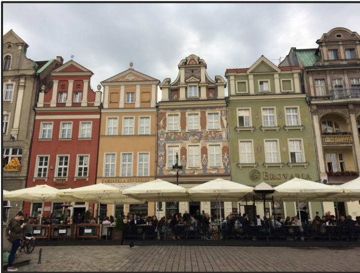
Torget i gamla stadsdelen

Jag är otroligt tacksam för att jag fick möjligheten att delta i HOPE- Kongressen! Den har gett mig kompetensutveckling och nya kontakter. Jag känner också att det gett mig ny inspiration i mitt spännande och betydelsefulla arbete som sjukhuslärare. Det känns viktigt att vi får träffas och delge varandra kunskaper och erfarenheter för att på så sätt komma närmare en likvärdig undervisning för sjuka barn och ungdomar. Jag rekommenderar varmt alla sjukhuslärare att någon gång delta i denna kongress!