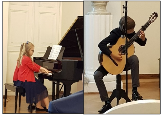
Barn från musikskolan